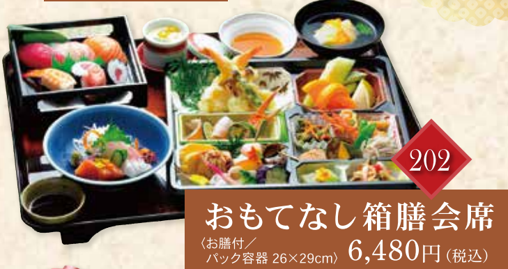
202 おもてなし箱膳会席 (お膳付/バック容器 26×29cm) 6,480円(税込)