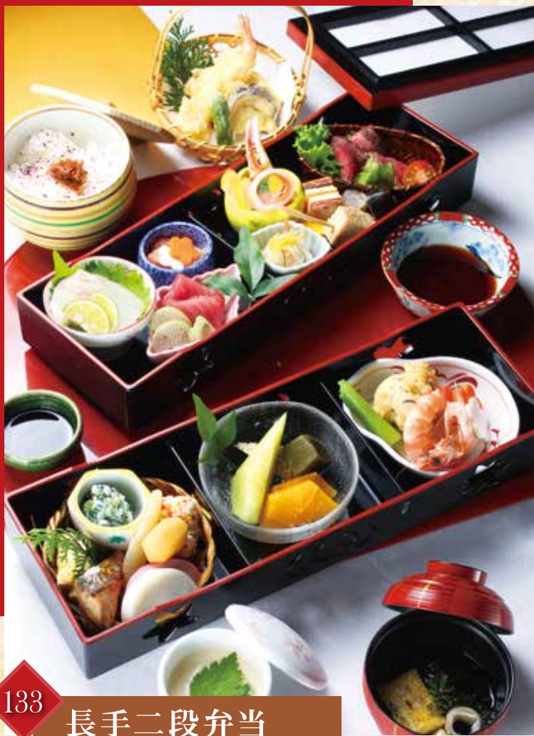
133 長手二段弁当 (12.5×36.3cm×2段) 5,400円(税込)