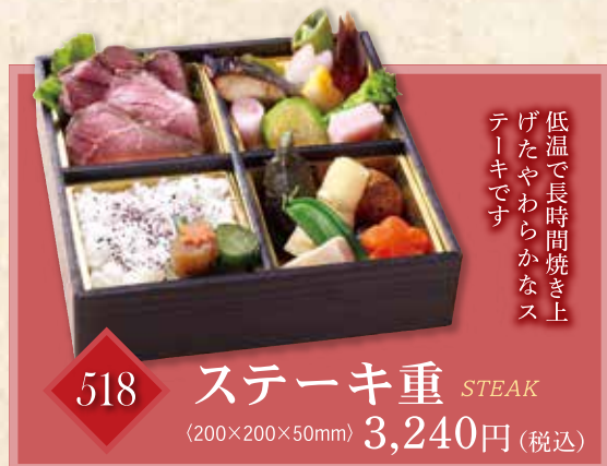
518 ステーキ重 STEAK (200×200×50mm) 3,240円(税込)