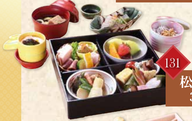
131 松花堂 (24.5cm角) 3,780円(税込)