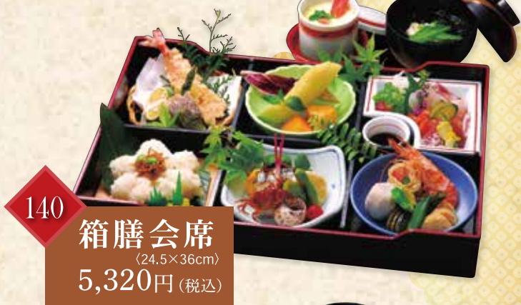
140 箱膳会席 (24.5×36cm) 5,320円(税込)