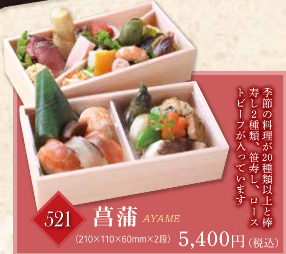
521 菖蒲 AYAME (210×110×60mm×2段) 5,400円(税込)