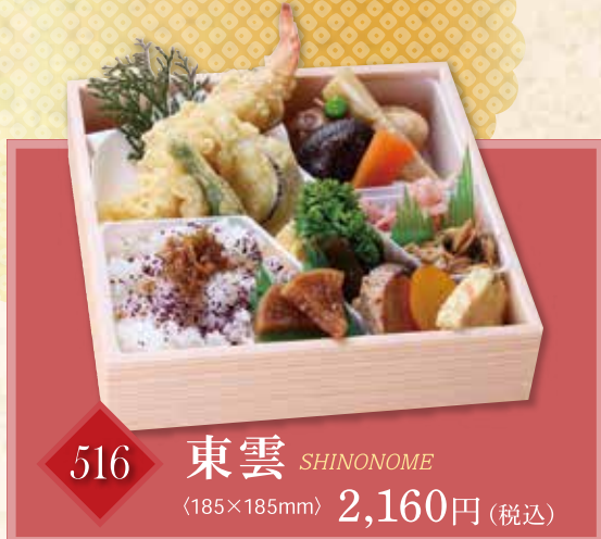
516 東雲 SHINONOME (185×185mm) 2,160円(税込)